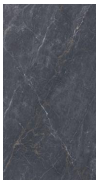
Este producto contiene 4 caras.